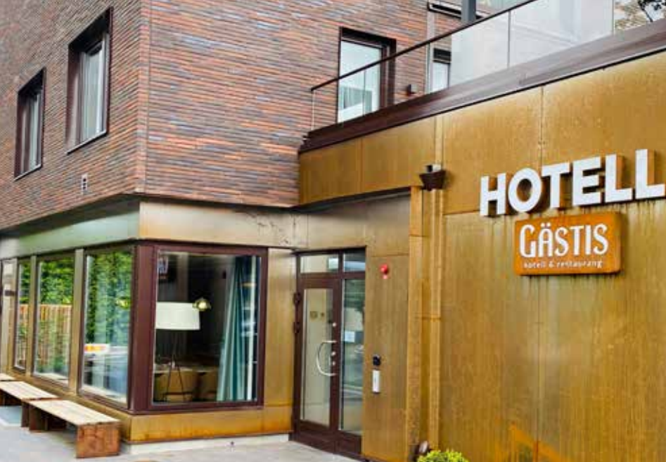
Hotell Gästis Nybyggnad av hotell i Staffanstorps