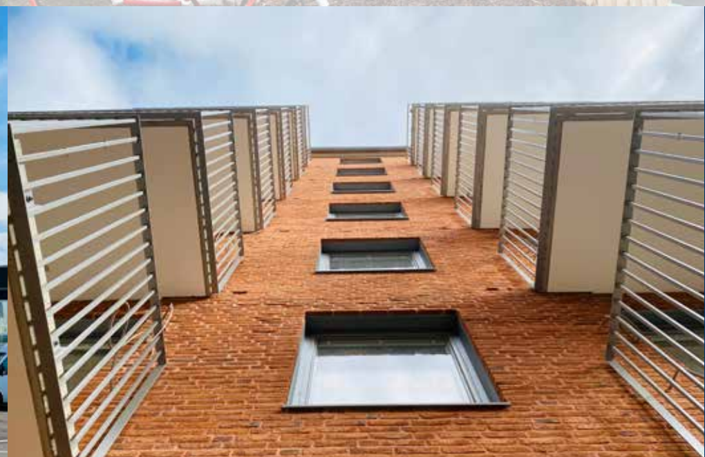
Smygmaskan 2 Nybyggnad av flerbostadshus i Hyllie åt MKB