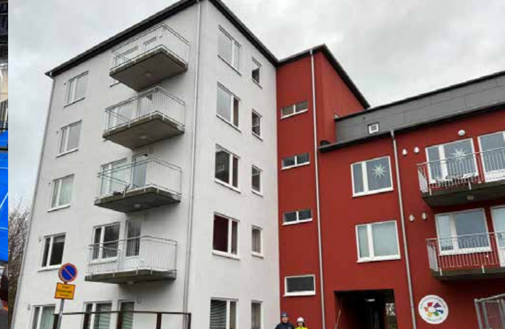
Kv. Rügen Fasadrenovering av bostadshus i Lund