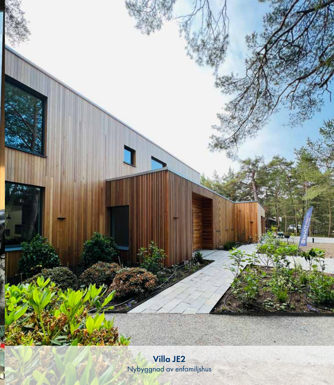
Villa JE2 Nybyggnad av enfamiljshus