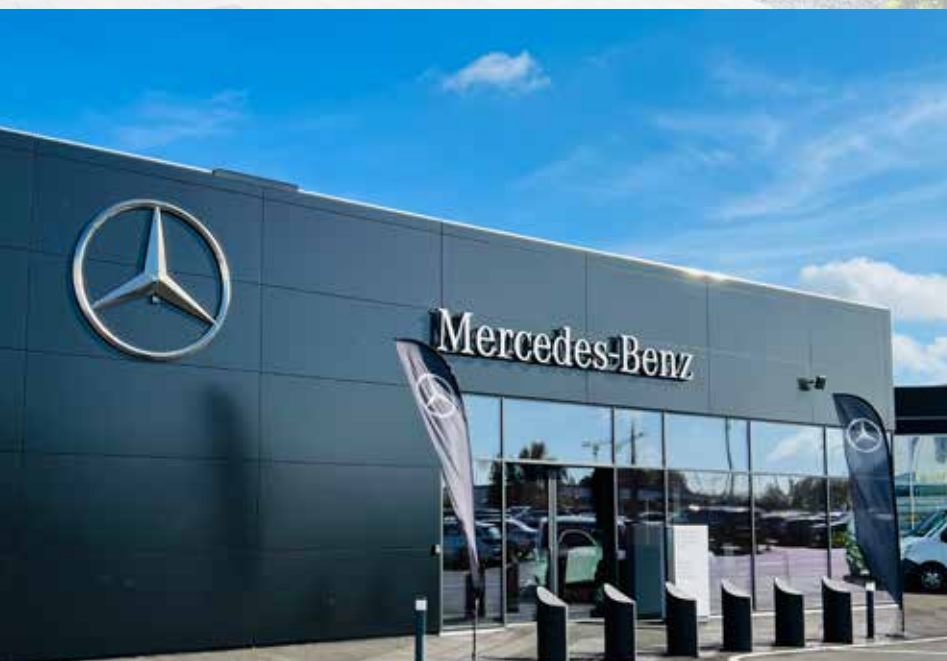
Mercedes-Benz Malmö Ombyggnad av bilhall i Malmö