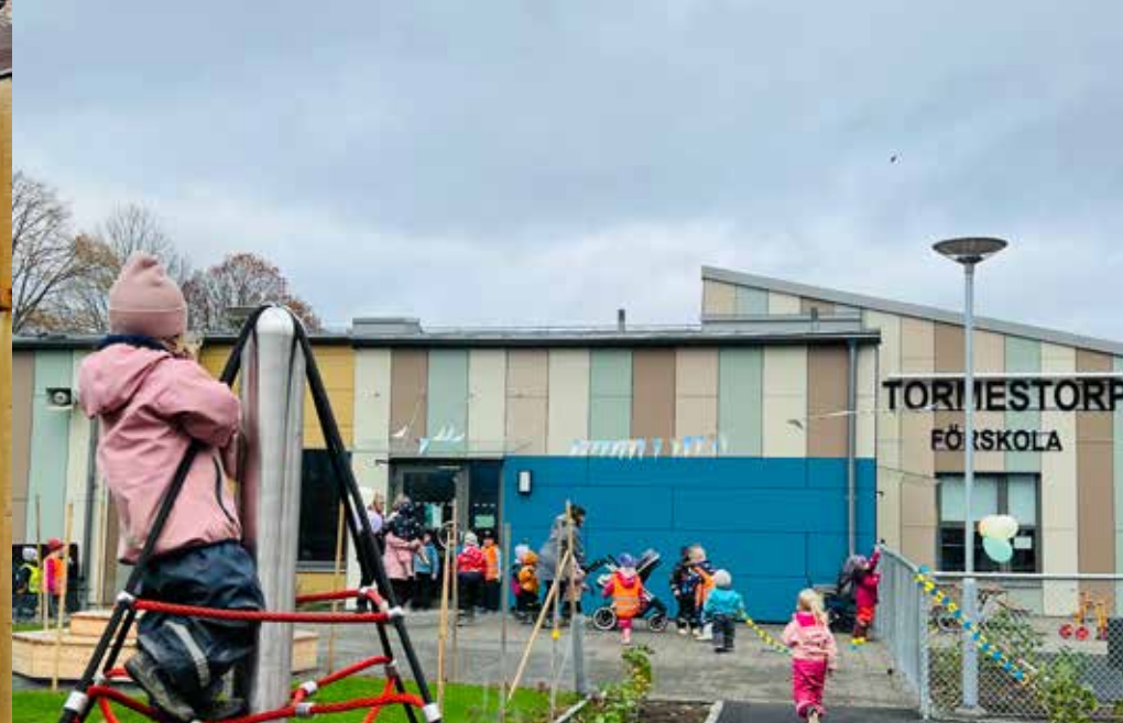
Tormestorp förskola Nybyggnad av förskola i Tormestorp