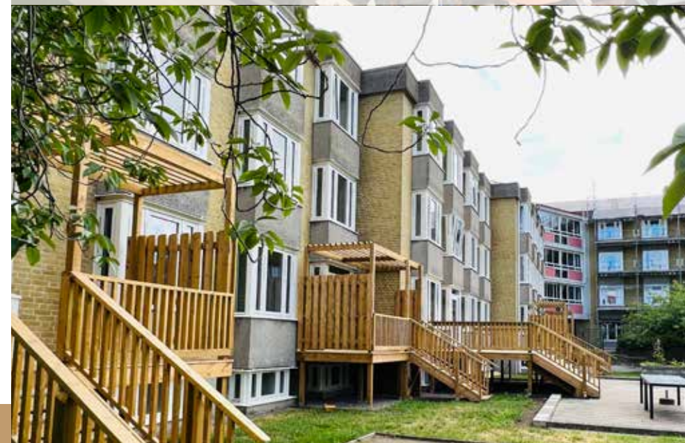
Artillerigatan Ombyggnad till särskiltboende i Landskrona