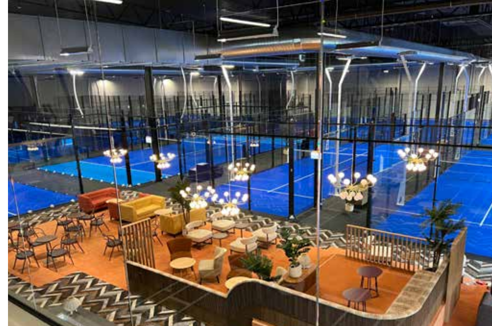
Padelhall - Kv. Tågarp Ombyggnad av industrilokal till padelhall i Arlöv

På kommande sidor kan ni se exempel på referensprojekt från våra olika affärsområden. Se fler på treano.se