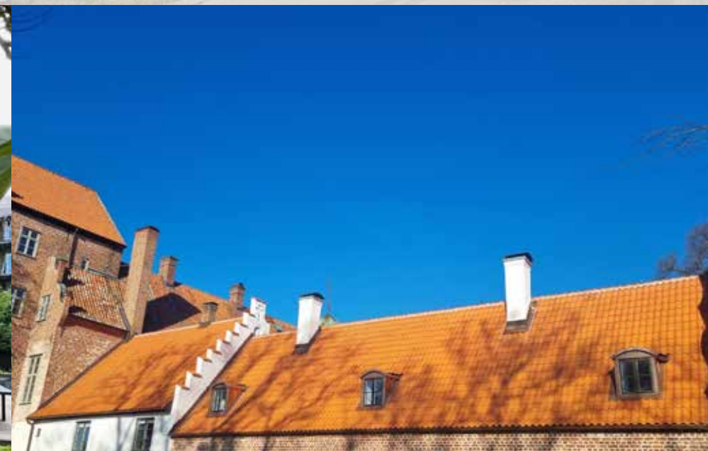
Bäckaskog slott Takomläggning på Munkalängan på Bäckaskog slott