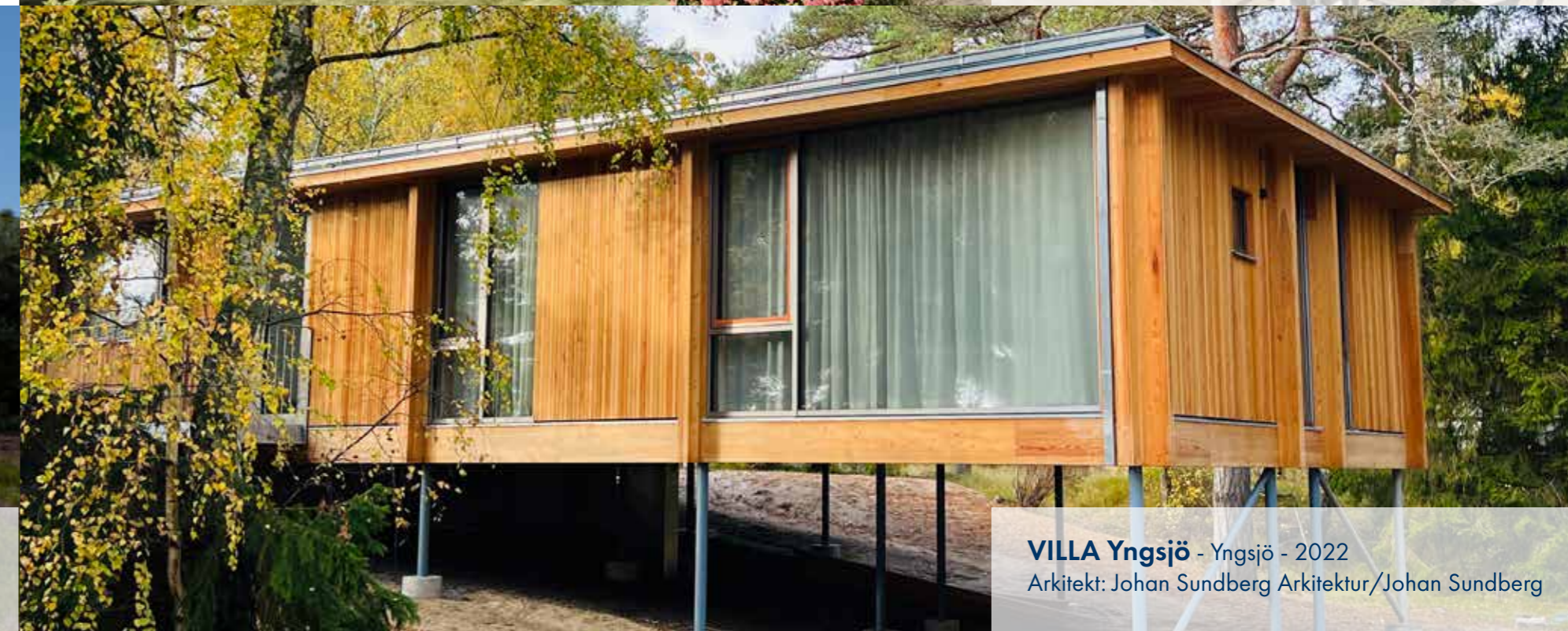
VILLA Yngsjö - Yngsjö - 2022 Arkitekt: Johan Sundberg Arkitektur/Johan Sundberg