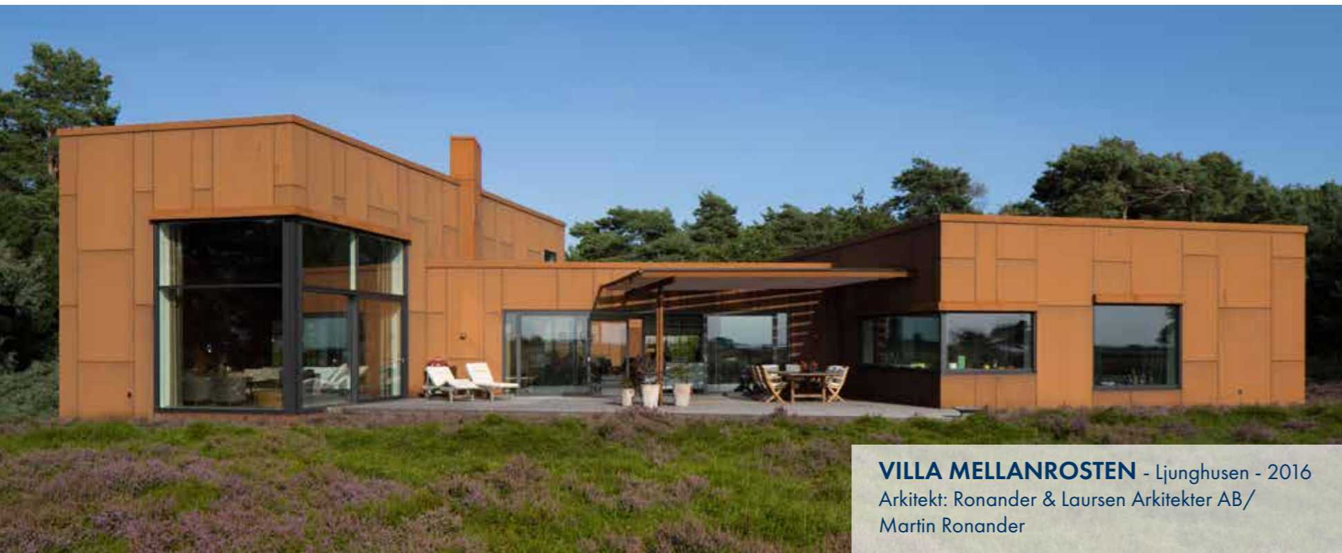
VILLA MELLANROSTEN - Ljunghusen - 2016 Arkitekt: Ronander & Laursen Arkitekter AB/ Martin Ronander