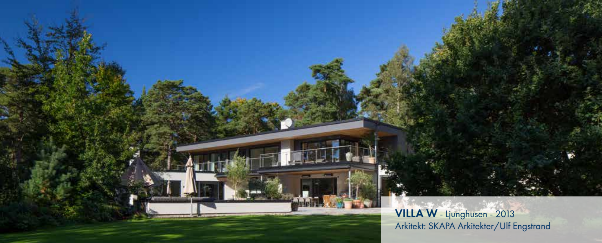
VILLA W - Ljunghusen - 2013 Arkitekt: SKAPA Arkitekter/Ulf Engstrand