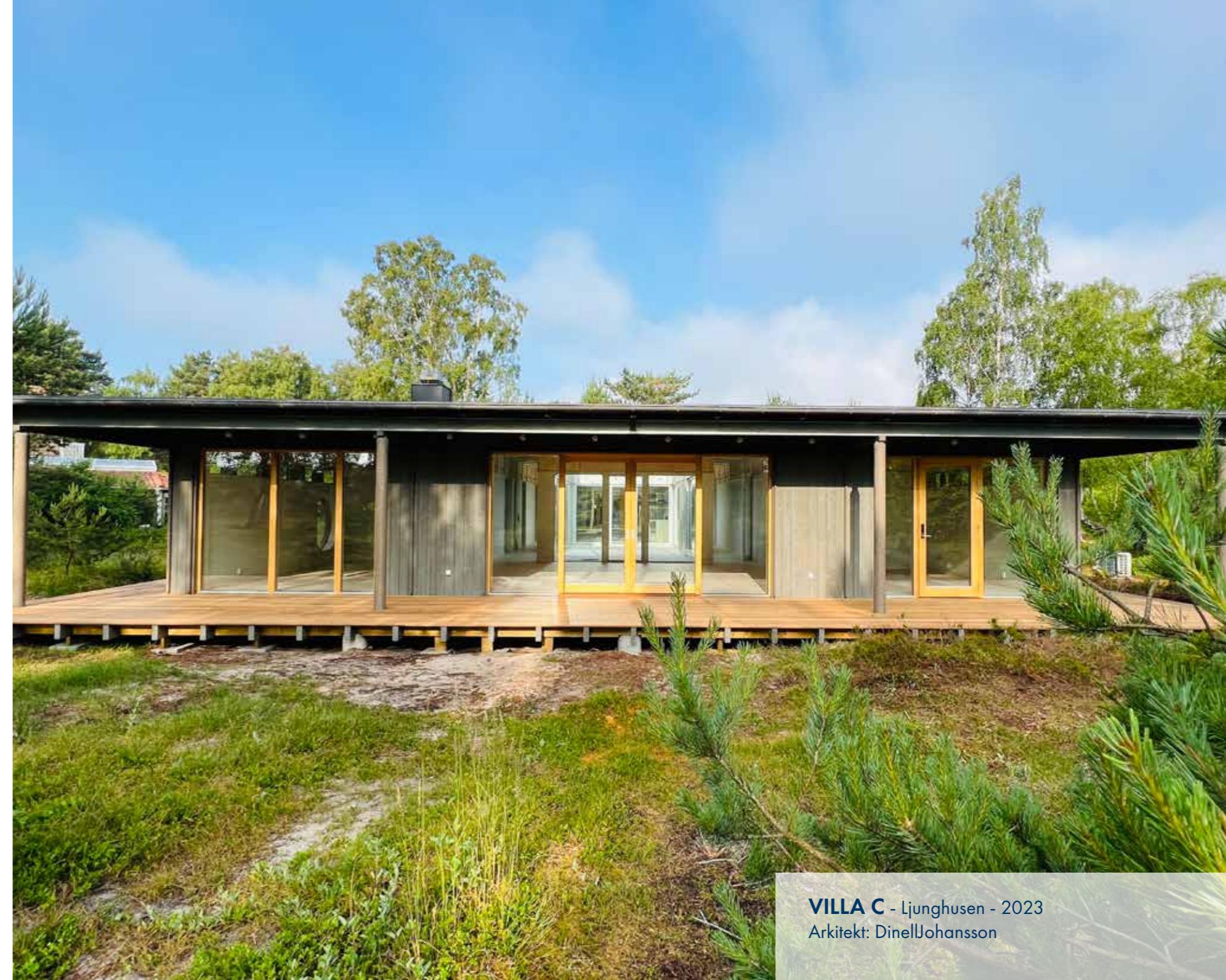
VILLA C - Ljunghusen - 2023 Arkitekt: DinellJohansson

Sawi erbjuder en unik villa som, i marknadsjämförelse, bidrar positivt till samhället med att minska klimatutsläpp i enlighet med LFM30, både under produktion och drift, till rimlig kostnad.