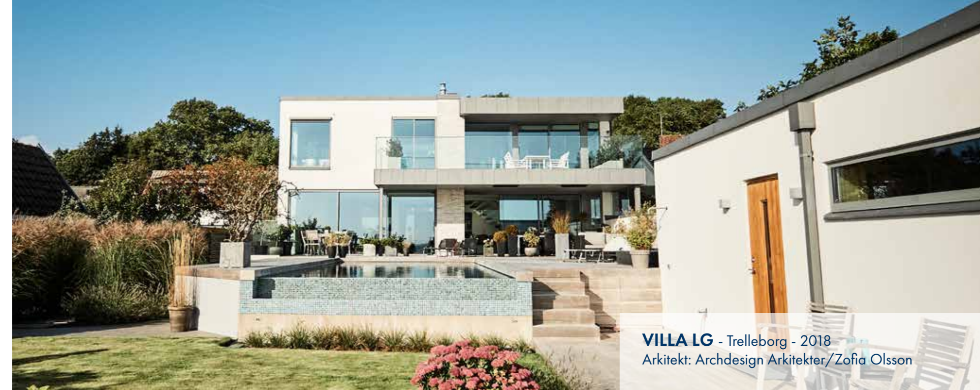
VILLA LG - Trelleborg - 2018 Arkitekt: Archdesign Arkitekter/Zofia Olsson

På de följande sidorna visar vi stolt upp några av våra referenshus, ni kan se fler på vår hemsida, www.treano.se .