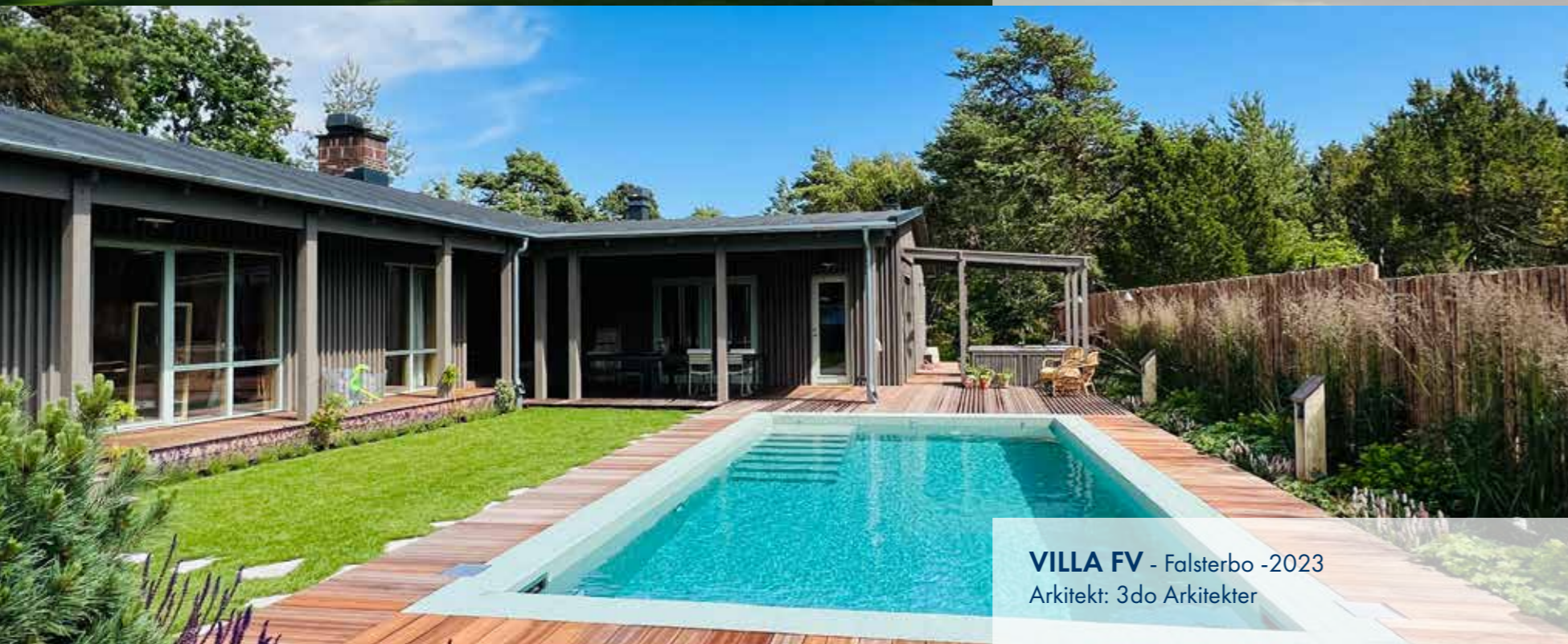
VILLA FV - Falsterbo - 2023 Arkitekt: 3do Arkitekter