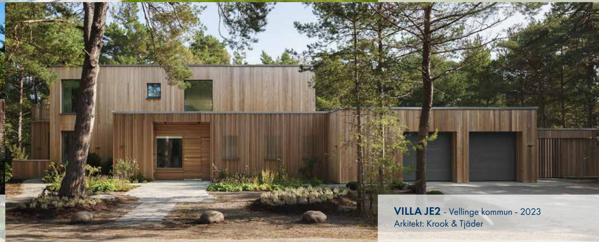
VILLA JE2 - Vellinge kommun - 2023 Arkitekt: Krook & Tjäder