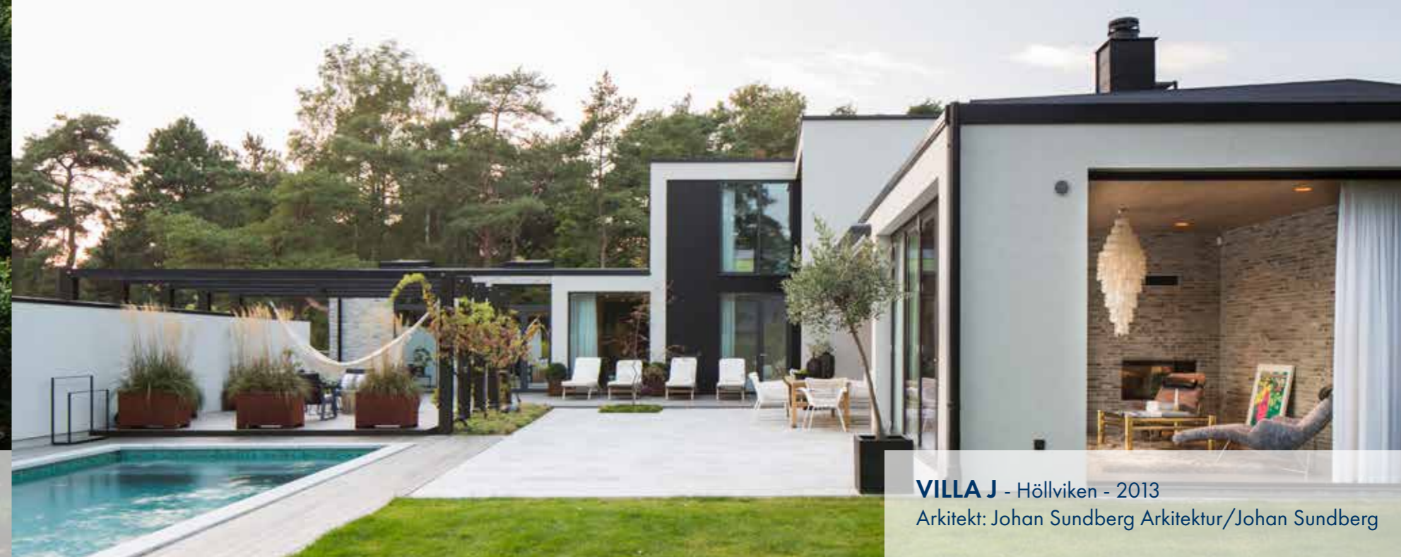
VILLA J - Höllviken - 2013 Arkitekt: Johan Sundberg Arkitektur/Johan Sundberg